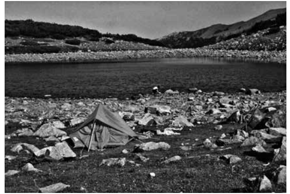
Dautov esero, endlich wieder Trinkwasser und ein Platz zur Übernachtung

Es hatte sich unter Freunden des Balkans herumgesprochen: Ein besonderes Highlight war und ist immer noch die Überquerung des Piringebirges entlang des Hauptkamms. Das Piringebirge ist im