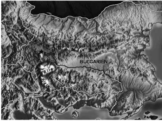
Reliefkarte mit den Gebirgen Bulgariens (basierend auf einer Karte von RosarioVanTulpe, Wikimedia Commons)

der Ostseeküste, für die Reservierungen heiß begehrt waren und nicht immer gelangen.