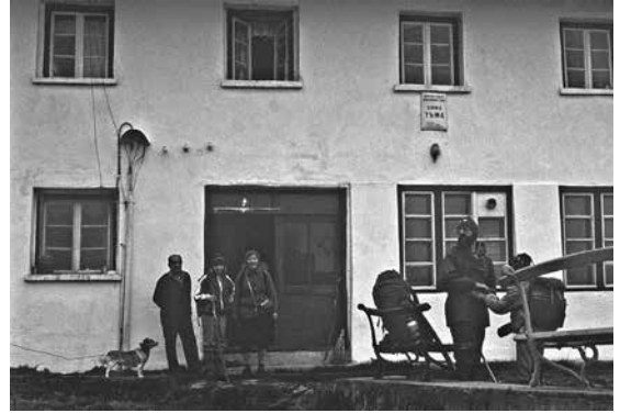
Eingang der Tashahütte