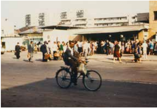
Anstehen nach Brot in Ploiești (Rumänien)

Reiseaufenthalt in Bulgarien und Rumänien in den 70er und 80er Jahren noch eine DDR-seitige bewilligungspflichtige Reiseanlage für den visafreien Reiseverkehr, die man bei seiner Volkspolizeidienststelle beantragen musste und die man in der Regel auch erhielt. Beide Länder waren für die Mehrzahl der Interessenten, auch für Individualreisende, beliebt, weil sie weite Uferbereiche, Hotels und attraktive Strände als Zugang zum Schwarzen Meer besaßen. Meeresküsten sind nach wie vor für viele eine Urlaubsattraktion, und das war für die Mehrzahl der DDR-Urlauber der Grund des Reiseinteresses für Bulgarien und Rumänien, denn die Kapazität, an der Ostsee seinen Badeurlaub zu verbringen, reichte für die DDR-Bürger keinesfalls aus.