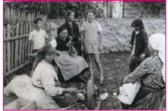
Ländliche Begegnung in einem bulgarischen Dorf

Wenigstens im Urlaub wollte man als DDR-Bürger einmal etwas frei sein, insbesondere da man vom