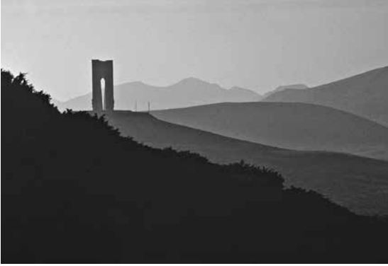
Schipka-Pass, Ausgangspunkt unserer Tour gen Westen