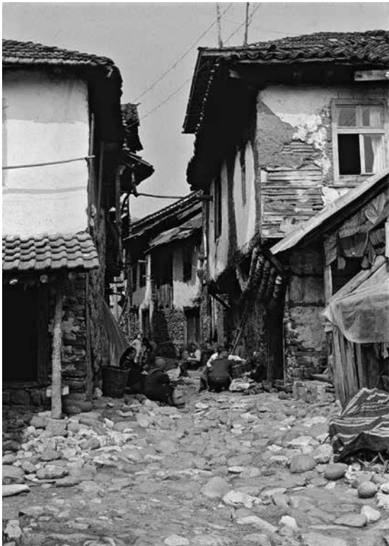
Unten: Ab Dorf Pirin gemeinsam weiter mit einer Jenaer Studentengruppe

gipfel Wichren wieder trafen. Alle Begebenheiten zu berichten, würde mehrere Seiten füllen. Deshalb sollen nur einige Erlebnisse während der Kammtour und nur einige Gipfel über 2500 m (von denen es 102 gibt) und Stationen explizit erwähnt werden. Eigentlich war der Gipfelgrat oben wegmäßig und optisch vorgegeben und verzweigte sich nicht stark. Wir folgten dem Grat über den Dautov vrach (2597 m), Albutin (2688 m), Kameniza (2726 m), Bajuwi Dupki (2820 m) zum Gipfel Besimen III (2836 m).